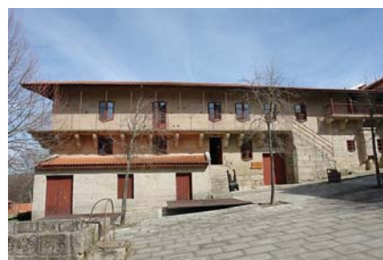
Torre Lombarda, actualmente pousada

A mediados de século a feira, que dende o s.XII se viña celebrando na Praza dos Brancos, trasládase por falla de espazo a O Toural, no lugar denominado A Barreira por estar comprendido entre esta, a muralla, e o Convento. Á mesma época pertence o Selo do Concello, depositado no A.H.P.O. Curiosamente presenta tres arcos e calzada horizontal na ponte, posiblemente inspirado aínda na romana desaparecida.