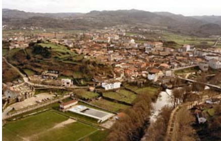
Monte onde estaba o Castelo

As testemuñas arqueolóxicas máis lonxanas da historia de Allariz adéntrannos no 1º milenio a.C. Petroglifos e restos de castros, nalgúns casos só topónimos, espállanse por toda a xeografía municipal. Salientan entre os primeiros o conxunto de A Padela, se ben atópanse rexistrados bastantes máis.