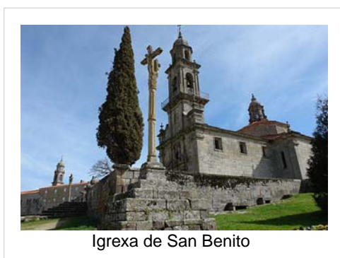
Igrexa de San Benito