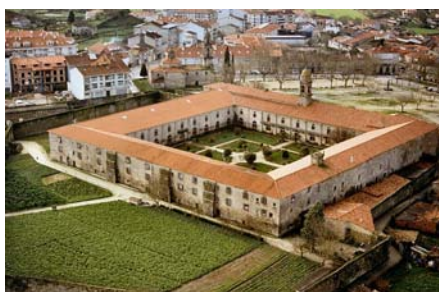
Vista do Convento de Santa Clara