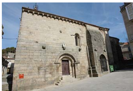
Igrexa de Santiago