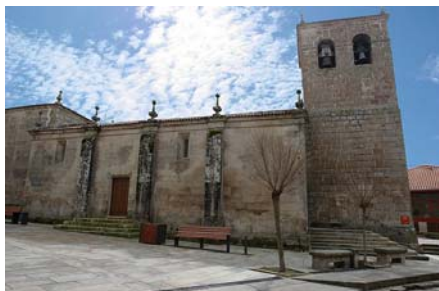
Igrexa de San Pedro

No último cuarto deste século, baixo o reinado de Fernando II, complétase o repertorio de igrexas románicas coa inauguración de S.Pedro e de Sta.María de Vilanova, ligada esta última á Orde de S.Xoán de Xerusalén ou Cabaleiros de Malta que tiveron recinto propio amurado – consérvase un pequeno lenzo do mesmo- para a defensa da ponte e entrada á Vila. Esta ponte de Vilanova mantense na actualidade aínda que modificada na segunda metade do s.XVI e co escudo da Vila no seu mirador.