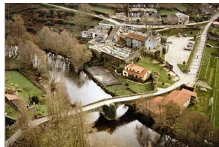
Vista aérea da Igrexa de Vilanova e a ponte

A cabalo dos séculos XII e XIII deberon producirse os primeiros asentamentos xudeus entre S.Pedro e Vilanova, así como o inicio da curtición. Destas mesmas datas,coincidindo co reinado de Afonso IX, serían o Hospital de Peregrinos, na rúa do Seixón, á entrada do Camiño de Santiago polo sur, e o Lazareto na rúa que aínda mantén o nome de S.Lázaro.